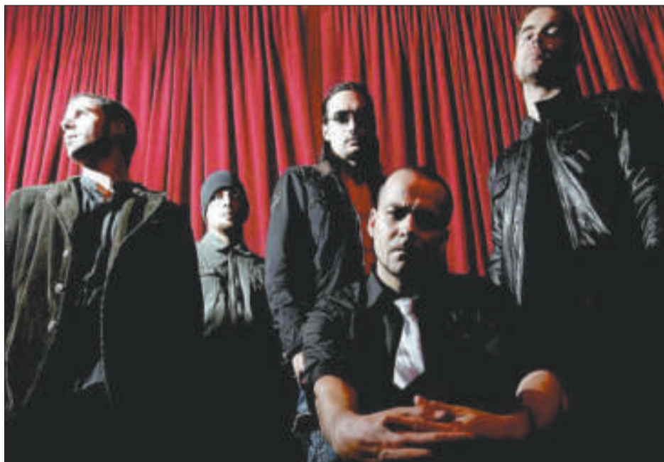
Zivil, preparats per triomfar (aquí i allà)

Contacte: zivil.management@gmail.com o 697 04 80 91 (Sergi).