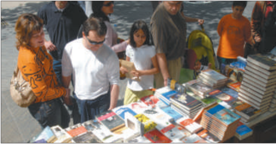
Els vilanovins celebraran Sant Jordi a la Rambla